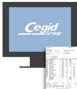
BULLETIN DE PAIE (Code du travail)